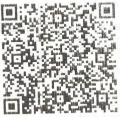
QR-Code APP de embarque

BP-e nº 000483664 Série: 000 29/01/2025 09:24:49