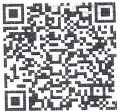
Consulta on-line BP-e

Protocolo de autorização: 342240003840142 Data de autorização: 26/07/2024 10:39:41