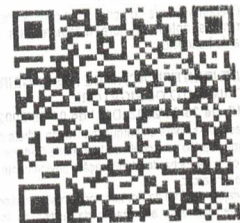
Consulta on-line BP-e

Trib. Totais Incidentes (Lei Federal 12.741/2012) - ICMS R$8,50 (12%) Outros Tributos: R$18,15 (25,45%)