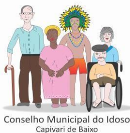
Conselho Municipal do Idoso Capivari de Baixo