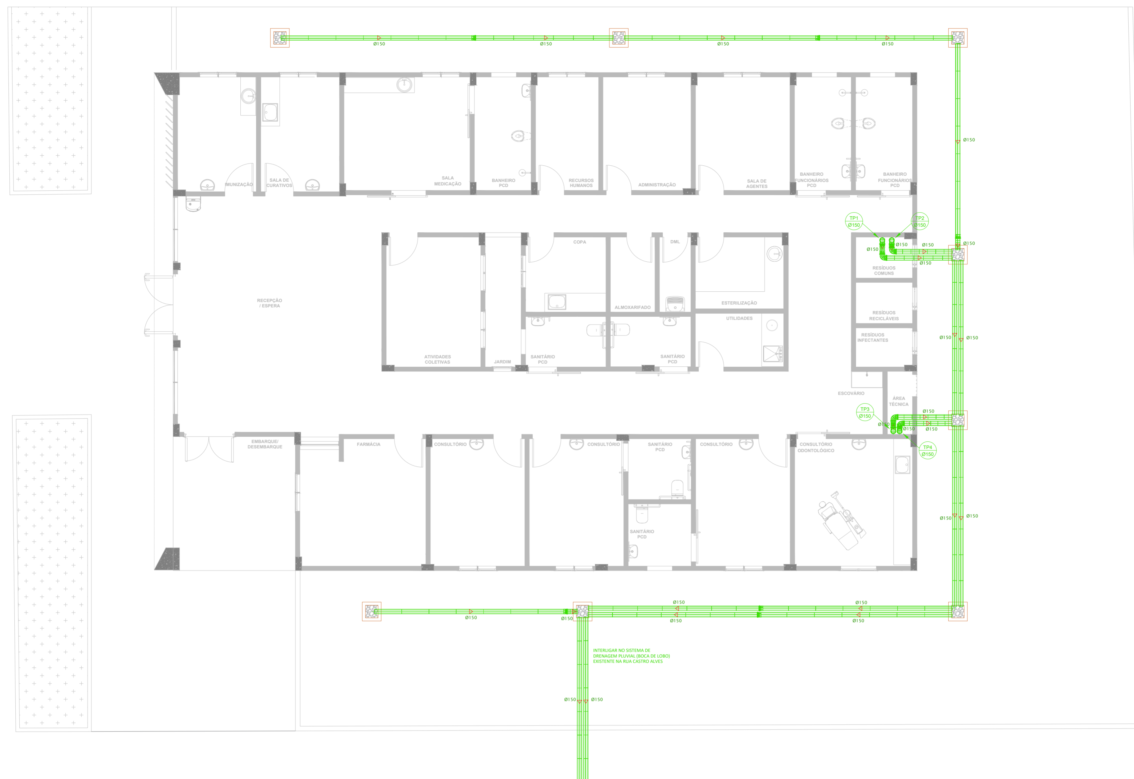
2 PLANTA BAIXA REDE PLUVIAL - NÍVEL TÉRREO ESCALA 1:75