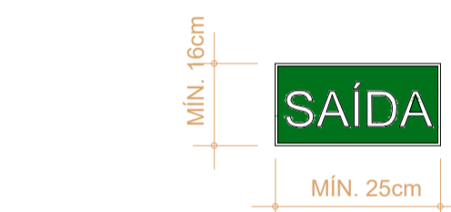
DETALHE PLACA FOTOLUMINESCENTE DE ABANDONO DE LOCAL ESCALA 1/25