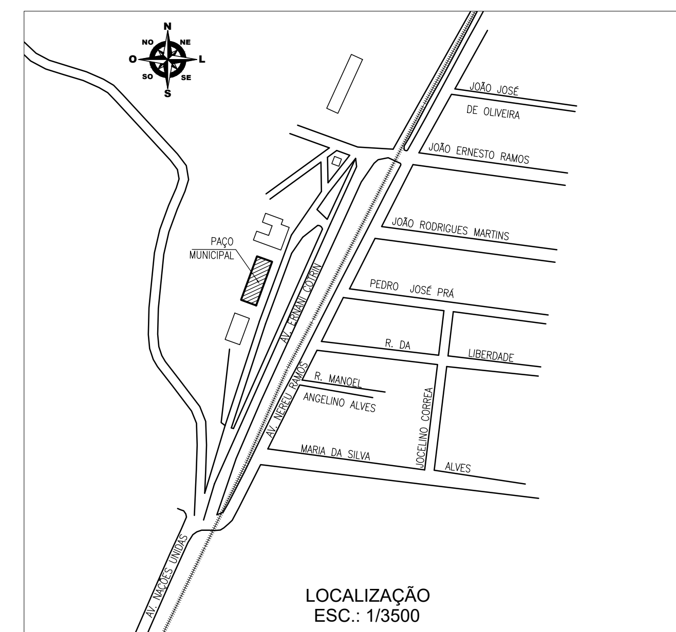
LOCALIZAÇÃO ESC.: 1/3500