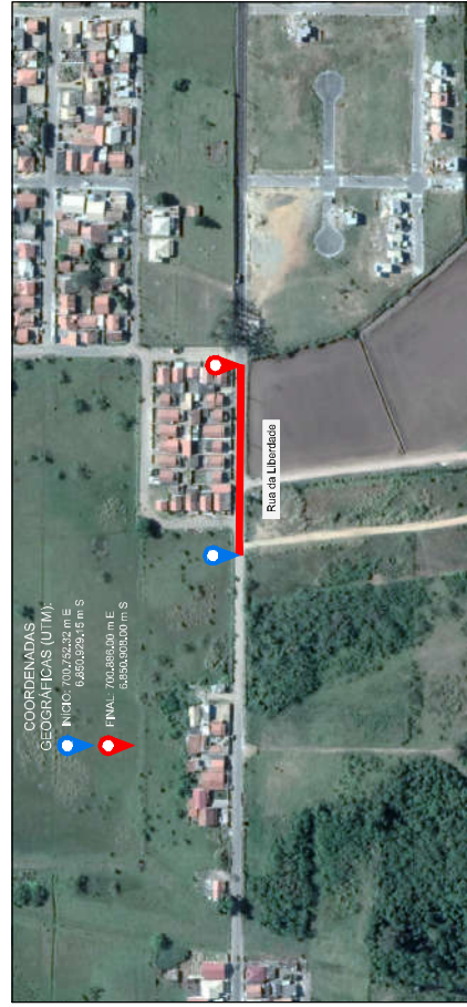
MAPA DE LOCALIZAÇÃO DA OBRA

Edição Gráfica: AMUREL - Associação de Municípios da Região de Laguna Fonte - Google Earth - 2017