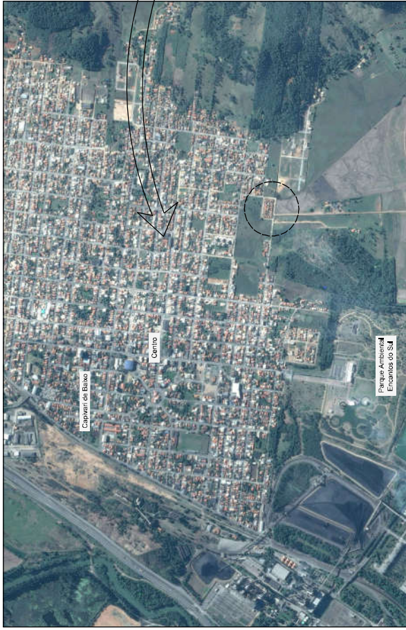
MAPA DE SITUAÇÃO DA OBRA NO MUNICÍPIO DE CAPIVARI DE BAIXO

Edição Gráfica: AMUREL - Associação de Municípios da Região de Laguna