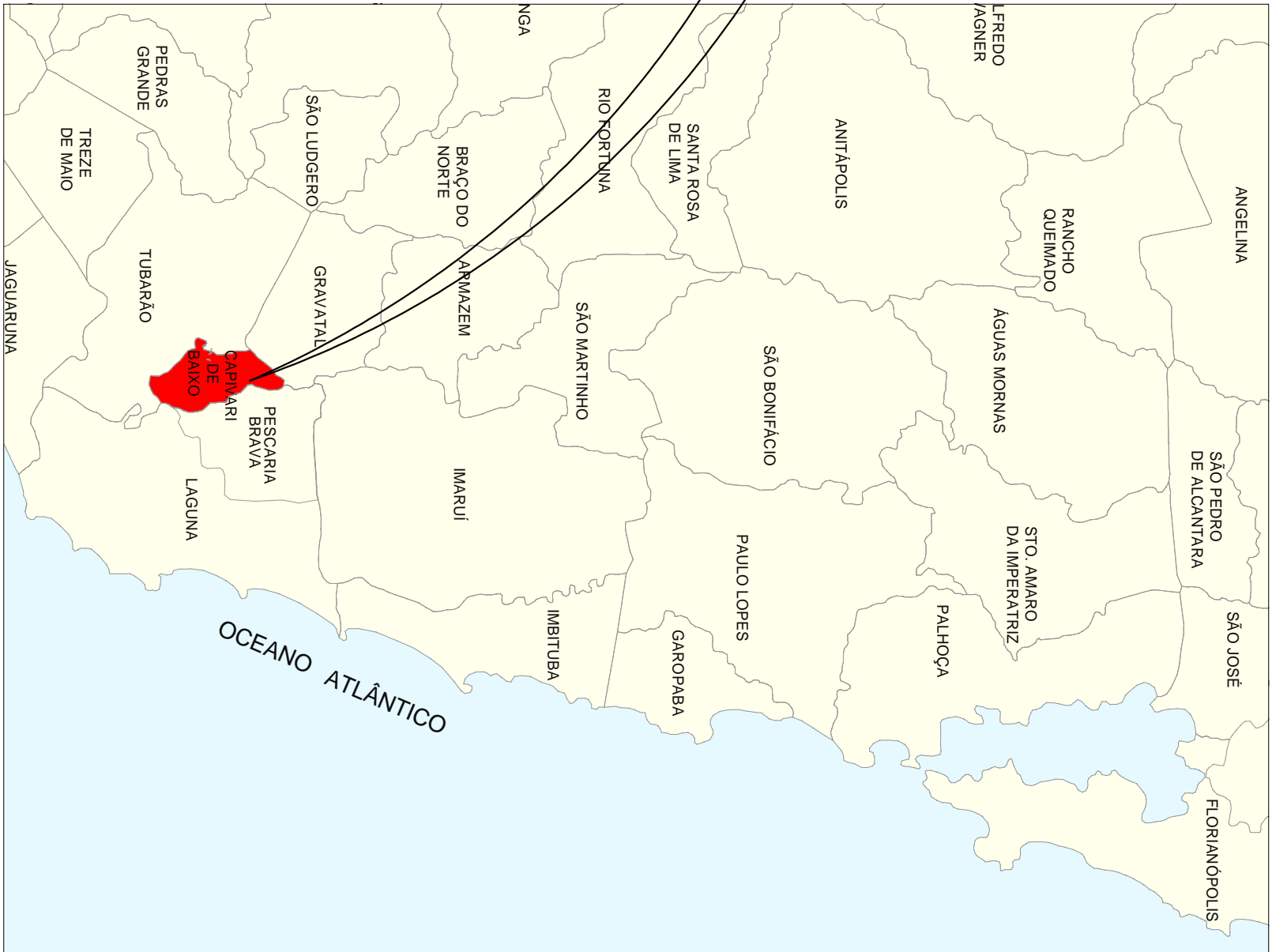
MAPA DE SITUAÇÃO DA OBRA NO MUNICÍPIO DE CAPIVARI DE BAIXO

Rua Julia Martins Machado - Trecho a ser pavimentado