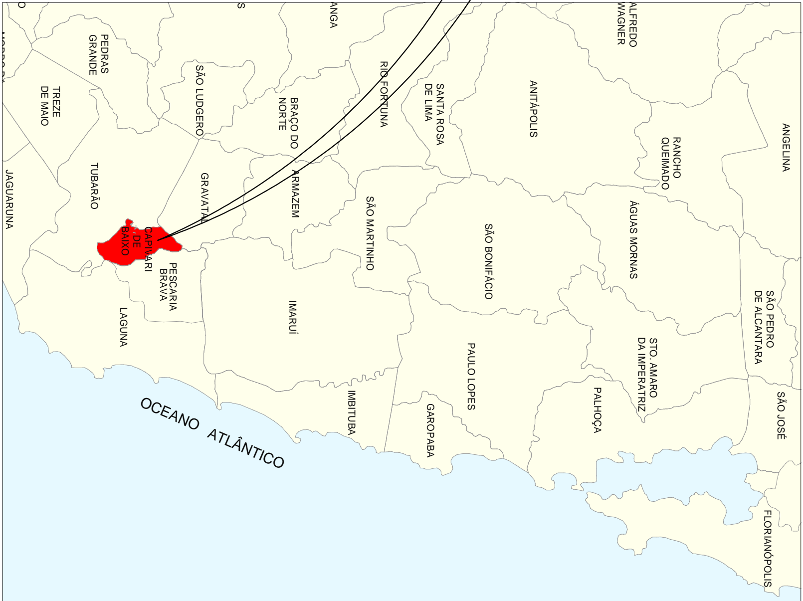
DIVISAS INTERMUNICIPAIS

LEGENDA: Rua Antônio Juvêncio Machado - Trecho a ser pavimentado