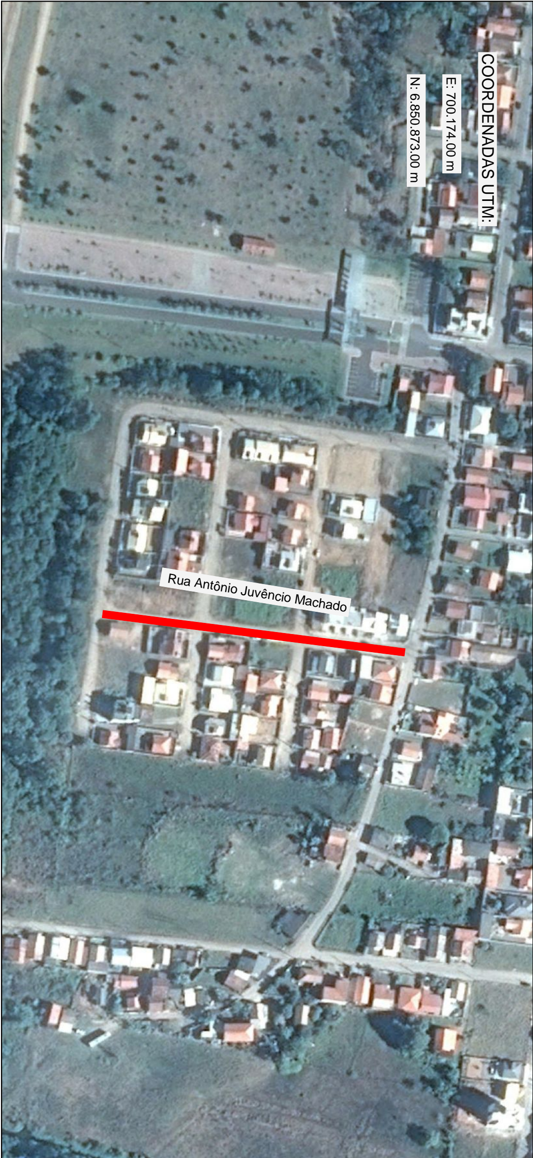
MAPA DE LOCALIZAÇÃO DA OBRA Edição Gráfica: AMUREL - Associação de Municípios da Região de Laguna

LEGENDA: Rua Antônio Juvêncio Machado - Trecho a ser pavimentado