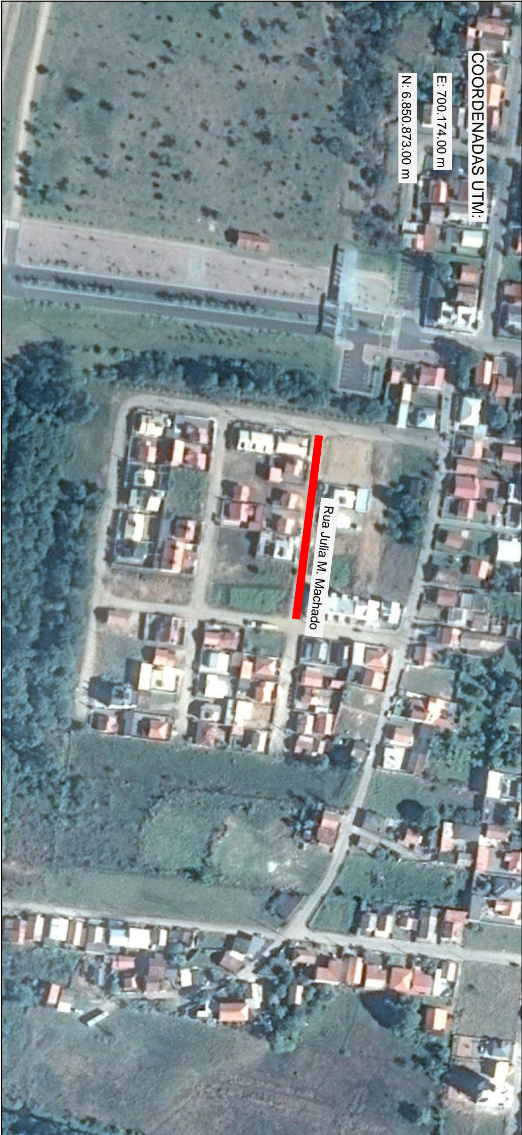
MAPA DE LOCALIZAÇÃO DA OBRA

Edição Gráfica: AMUREL - Associação de Municípios da Região de Laguna