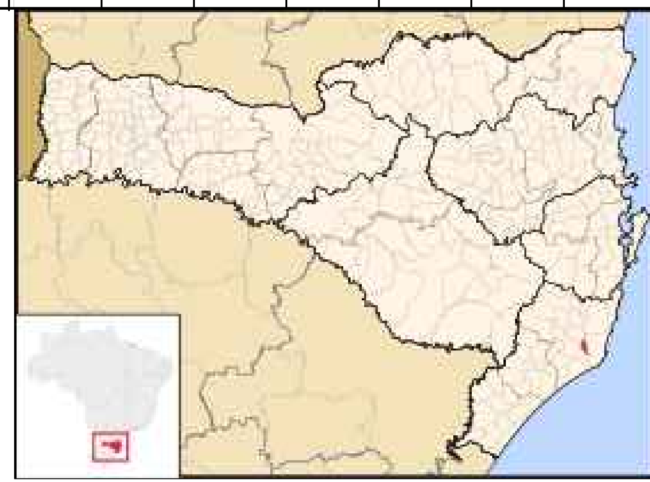
LOCALIZAÇÃO DO MUNICÍPIO