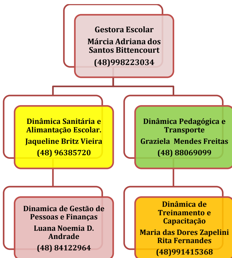
Figura 2: Organograma de um Sistema de Comando Operacional (SCO)

Para a devida aplicação da metodologia proposta, cada uma das caixas no organograma deve ser devidamente nominada (responsável) e identificada com telefone, e-mail, watasapp da pessoa com poder de decisão. Para facilitar a utilização e visibilidade pode-se criar um mural para comunicações, avisos, indicação dos responsáveis e contatos de emergência.